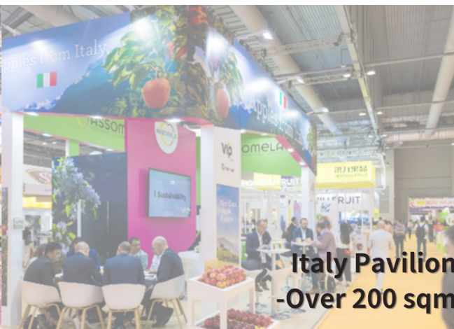
Italy Pavilion - Over 200 sqm