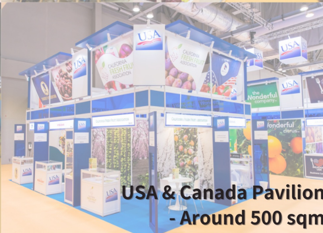
USA & Canada Pavilion - Around 500 sqm