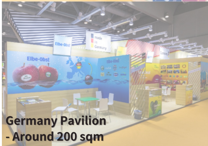
Germany Pavilion - Around 200 sqm