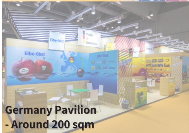
Germany Pavilion - Around 200 sqm