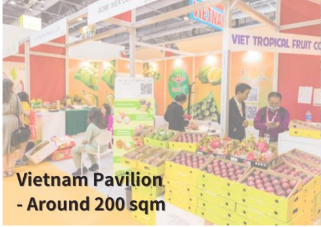
Vietnam Pavilion - Around 200 sqm