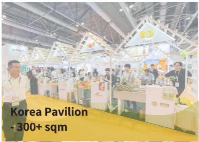
Korea Pavilion - 300+ sqm