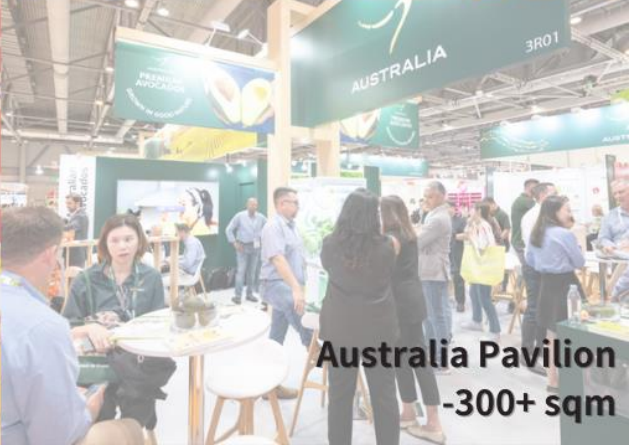
Australia Pavilion - 300+ sqm