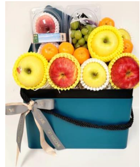
Luxury Japanese Fruit Hamper