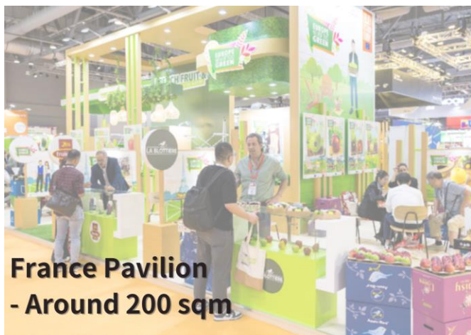
France Pavilion - Around 200 sqm