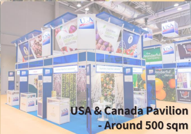
USA & Canada Pavilion - Around 500 sqm