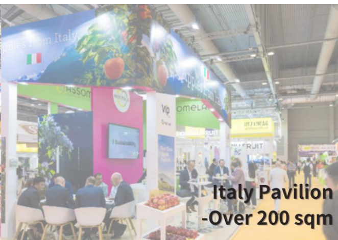
Italy Pavilion - Over 200 sqm